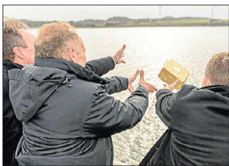
Den guldbelagte sten blev kastet fra borde på SamsøFærgen.

Region Midtjylland har siden 2014 organiseret samarbejdet i investeringsprogrammet "CeDEPI", hvor 11 kommuner har fået adgang til rådgivning frem mod investeringer i energieffektive løsninger i bygninger og gadebelysning.