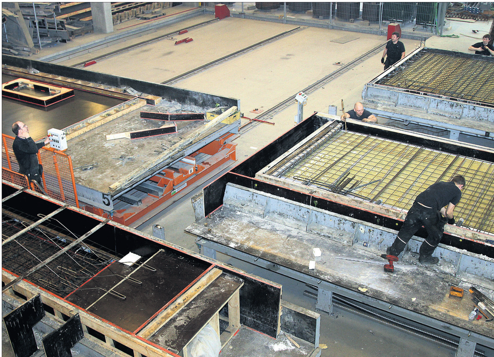
Både nye og gamle ansatte er fordelt i de to haller, hvor vi så kører sidemandsoplæring både i forhold til opgaver og mentalitet.