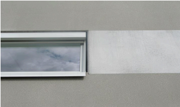
Eksempel på facade med hhv. afsyret og glat overflade

Trykket kan varieres i samme interval som for almindelig højtryksrensning. Metoden er på samme tid effektiv og relativt skånsom ved betonoverfladen hvis der anvendes lavt tryk. Betonen kan sagtens tåle temperaturen. Metoden er særligt effektiv overfor tyggegummi, olie og andre genstridige belægninger.